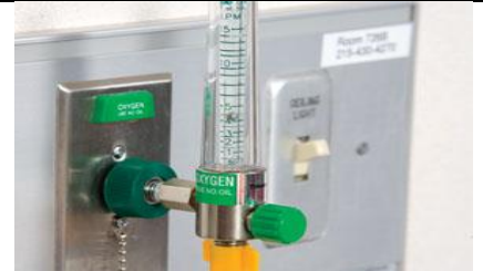
اکسیژن را به مقدار دستور داده شده تنظیم کنید.