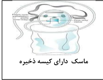
ماسک دارای کیسه ذخیره