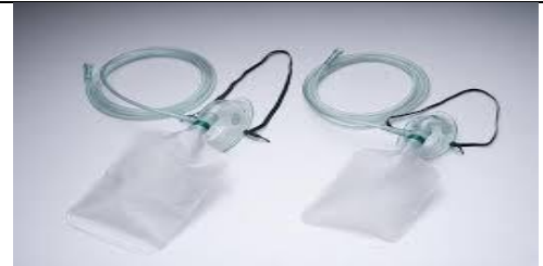
ماسک را با اندازه مناسب انتخاب، به مانومتر وصل کنید.