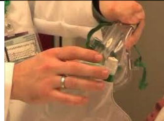
جریان اکسیژن را از انتهای ماسک کنترل کنید.