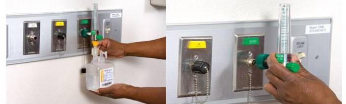
سیلندر اکسیژن و مانومتر را چک و بررسی کنید (از نظر پر بودن کپسول و عدم نشتی و وجود آب مقطر در سیستم مرطوب کننده)