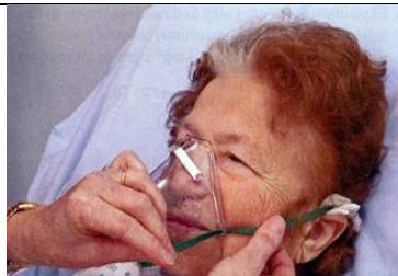
نوار فلزی روی پل بینی را فشار دهید.