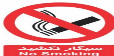
علامت سیگار نکشیدن را بالای تخت مددجو نصب کنید