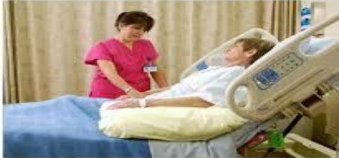
مددجو را در پوزیشن نیمه نشسته قرار دهید.