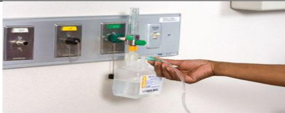
با باز کردن شیر اکسیژن، لوله و مسیر عبور اکسیژن را از نظر انسداد بررسی کنید.